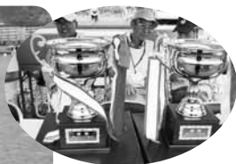
優勝カップ目指して280名の選手が競いました