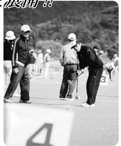
穏やかな秋空の下で試合が行われました。和やかに談笑する姿も見られ、参加者の交流も深まりました