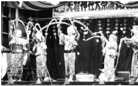
揃いの衣装で練習の成果を披露 客席からの応援がとてうれしいです

次郎長の仁義、水戸黄門、落語の「じゅげむ」、昔話の語り芝居、弁天娘女白浪の口上、長生き音頭等、役を分担して感情を込めて演じています。セリフを忘れてちよつと詰まった時、客席から「ガンバレ」と声がかかるとうれしくて、気持ちはずます宇宙に昇ります。そして新しい演目にチャレンジすることも大切だと考えています。