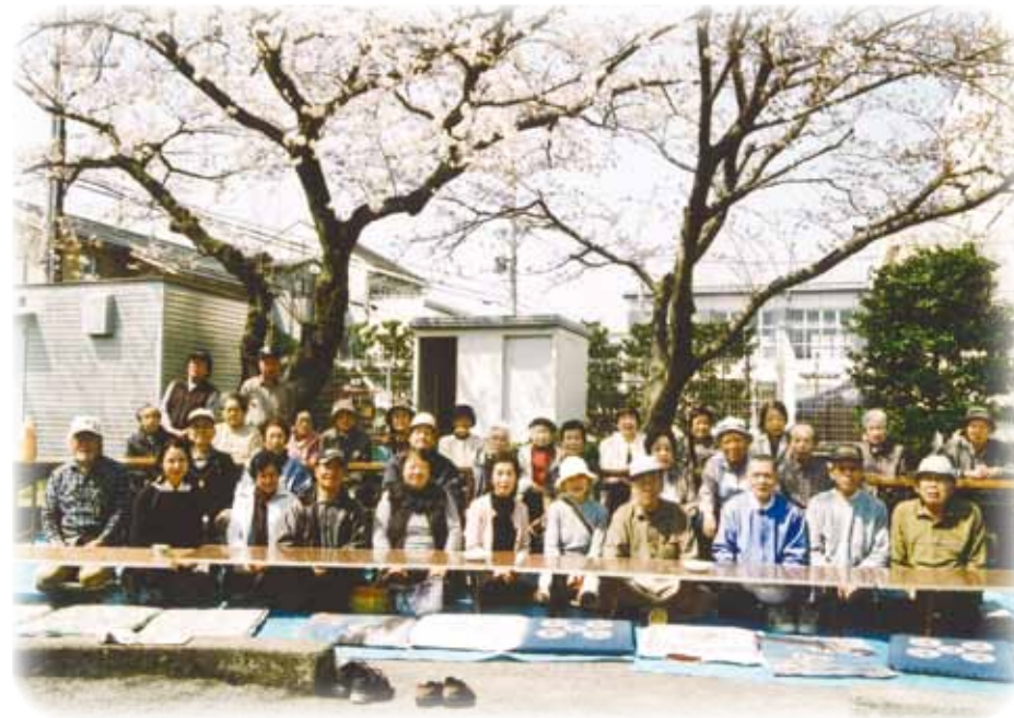
春のお花見会にて記念撮影 みんなで集まり、交流を持つことが日々の生活に潤いを与えてくれます

私たちのクラブがある葵区一番町に、昭和53年頃ふたつの老人クラブが出来ました。これは一番町の地形が700mほどもある細長い地形の町のためだと思えます。そして上と下の二つの老人クラブは昭和60年4月に併合され「一番町一寿会」が誕生しました。 現在の会員数は55名です。それほど大きなクラブではありませんが、行事や活動では団結をして非常にまとまりのある良いクラブです。 一寿会は会員が集い、互いに楽しみ、憩い、親睦を図りながら、日常の生活をより心豊かに過ごすことを目標にしています。 行事も毎月第2金曜日を「憩いの日」と定めて集会