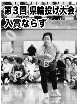
第3回県輪投げ大会 入賞ならず

12月5日(金) 第3回シニアクラブ静岡県輪投げ大会が焼津市総合体育館(シーガルドーム)にて53チームが参加し、開催されました。静岡市からも6チームが参加しましたが、13位の由比Aチームが最高で、残念ながら入賞はなりませんでした。