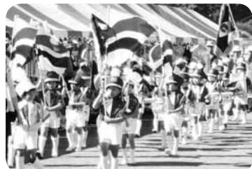
園児による鼓笛隊の演奏行進