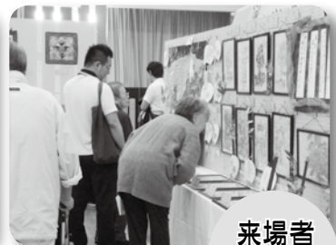
会場は多くの来場者で賑わいました