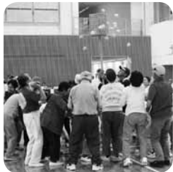
玉入れ競技 投げる力加減が難しいです

総勢約750名を前に、会長並びに大会委員長の力強い開会の辞に始まり、各競技が次々に進行し、応援席からの声援にも押され、誰にも親しまれる大会が定着しました。(鈴木 健仁)