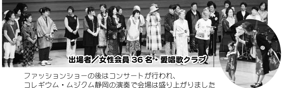
出場者/女性会員 36名・愛唱歌クラブ

ファッションショーの後はコンサートが行われ、 コレギウム・ムジクム静岡の演奏で会場は盛り上がりました