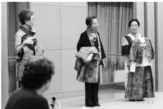
自らモデルになり自慢の衣装を披露しました

午後からは、三区女性会員の代表者による事例発表が行われ、駿河区は丸子新田の公民館・公園が出来て老人クラブに賛同して加入者が増えたという報告でした。葵区からは楽しい行事を次々と行い、楽しい老人クラブ活動が伝わって