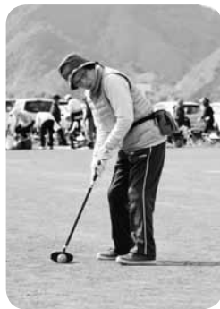
打つ前の真剣な表情 狙うはホールインワン