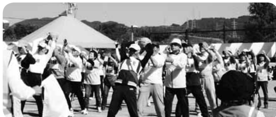
順送球 みんなのチームワークが大事です