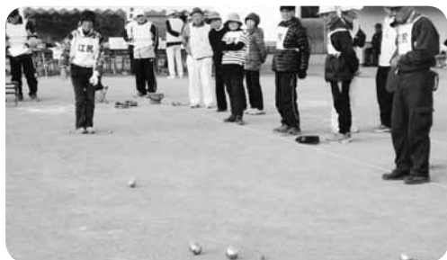
みんなで試合の行方を見守ります

今回優勝した清水区庵原地区、原長養会Bチームが、ねりんピック山口2015ペタンク交流大会の静岡市代表として出場をいたします。なお、服部市老連会長もチーム監督で出場しました。