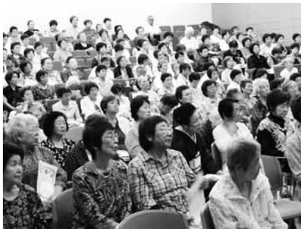
代表者の事例発表に 真剣に耳を傾けています

午後からは、三区女性会員の代表者による事例発表が行われ、駿河区は丸子新田の公民館・公園が出来て老人クラブに賛同して加入者が増えたという報告でした。葵区からは楽しい行事を次々と行い、楽しい老人クラブ活動が伝わって