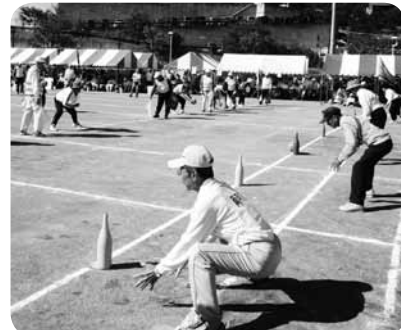
秋晴れの中での競技、気分爽快!!

大会では袖師地区嶺保育園児の鼓笛隊演奏行進のあと、21地区代表チームにより競技7種目が盛大に行われました。(辻 幹夫)