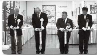
セレモニーでは テープカットが 行われました

期 間 / 11月26日(水) ~ 30日(日) 会 場 / 静岡市民ギャラリー 参加団体 / 静岡市老人クラブ連合会葵区支部・駿河区支部 老人福祉センター・老人ホーム・福祉団体