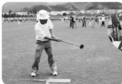
ロングホールはカー杯打ちます