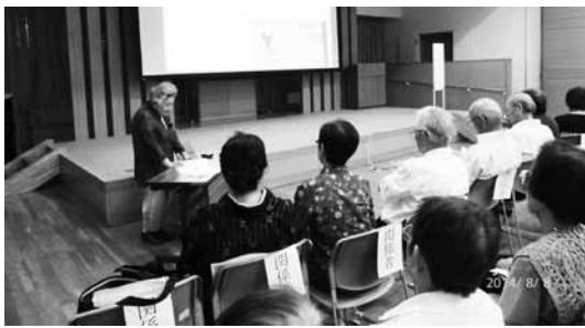
各支部とも工夫をこらした活動の様子を 発表しました

あ清水6階多目的ホールにおいて、参加者200名(葵区支部60名・駿河区支部50名・清水区支部90名)により三区女性会員合同交流会が開催されました。午前は久能山東照宮の落合偉州宮