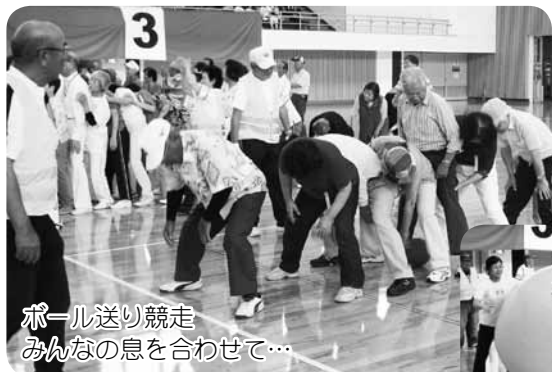
ボール送り競走 みんなの息を合わせて...