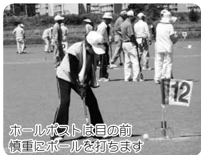
ホールポストは目の前 慎重にボールを打ちます

穏やかなスポーツ日和、私たち駿河区支部のグラウンド・ゴルフ大会が開催されました。参加者の皆さんは真剣な眼差しでクラブを振り、健康づくり、体力づくりをめざしてプレーを楽しみ、スコアを競い合いました。