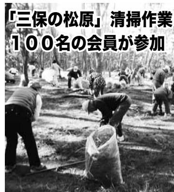
「三保の松原」清掃作業 100名の会員が参加

11月17日(月) 午前10時、秋晴れの下、清水区支部会員100人が参加しました。松の落ち葉をかき集めて袋詰めしたり、草取りに1時間余汗を流しました。(辻 幹夫)